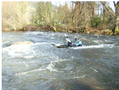
Oben bei 115 cm ...