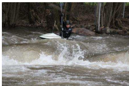
Oben bei 130 cm ...