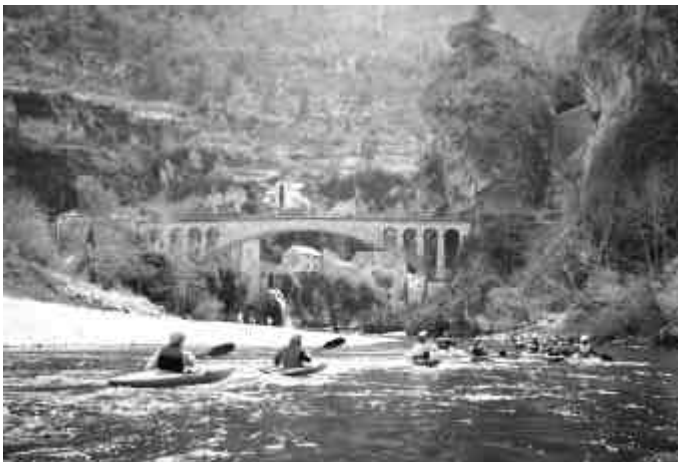
Die Schlucht des Tarn