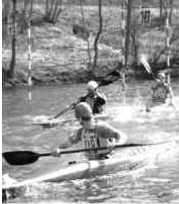
Die Herrenmannschaft

Bei einer Vorstandssitzung der Elzwelle im Spätsommer 2002 stand unsere neue Slalom-Trainingsstrecke auf der Tagesordnung, und unter den Vorständen wurde eine Vision geträumt: „Wenn wir vielleicht mal in vier oder fünf Jahren ein eigenes Slalomrennen veranstalten ...“. Beim Lehrgang zur Leistungsdiagnose der badischen Slalomsportler im November 2002 in Rheinsheim rückte diese Vision dann plötzlich ganz nahe. Ulrike Zimmermann, Slalom-Wartin im Badischen Kanuverband, fragte mich, ob wir bereit wären, auf unserer neuen Strecke die Badische Meisterschaft auszurichten.